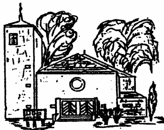
Hl. Familie, Rentrisch