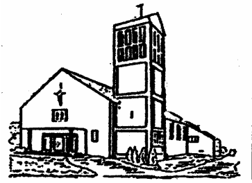
St. Theresia, Schafbrücke-Bischnisheim

Pfarrbrief Nr. 5 vom 26.04. bis 01.06.2008